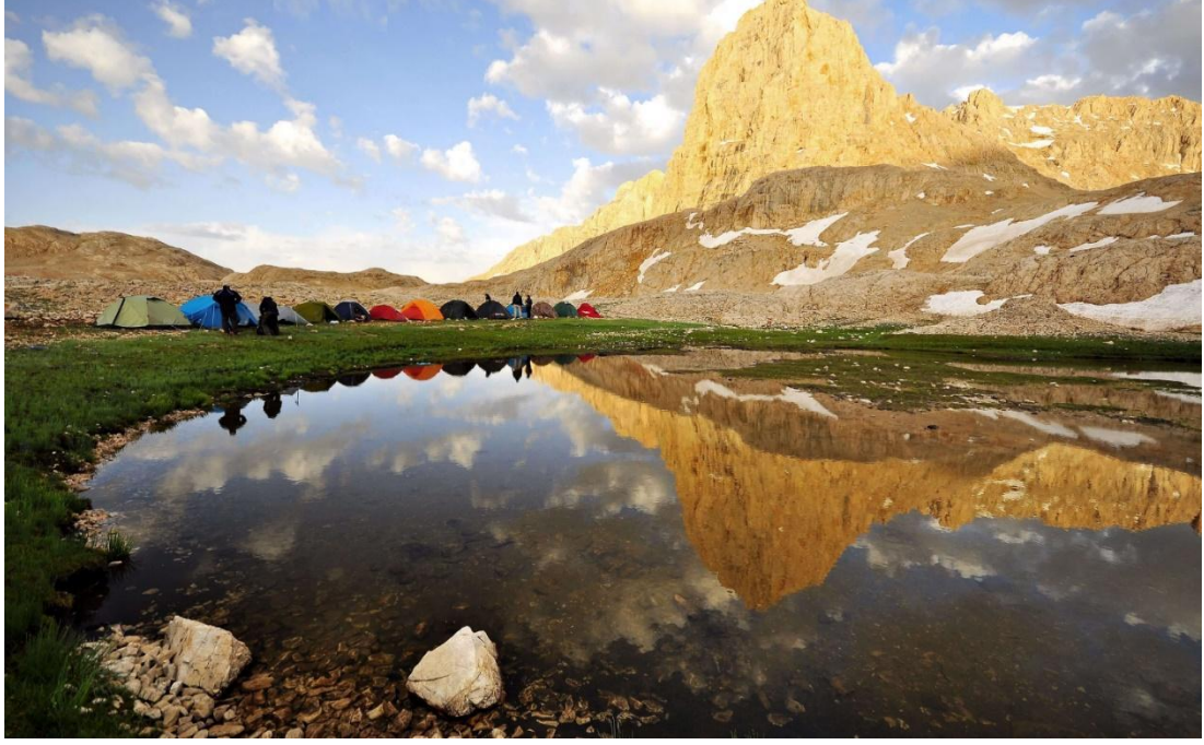
Şekil 10. Meydan Yaylası