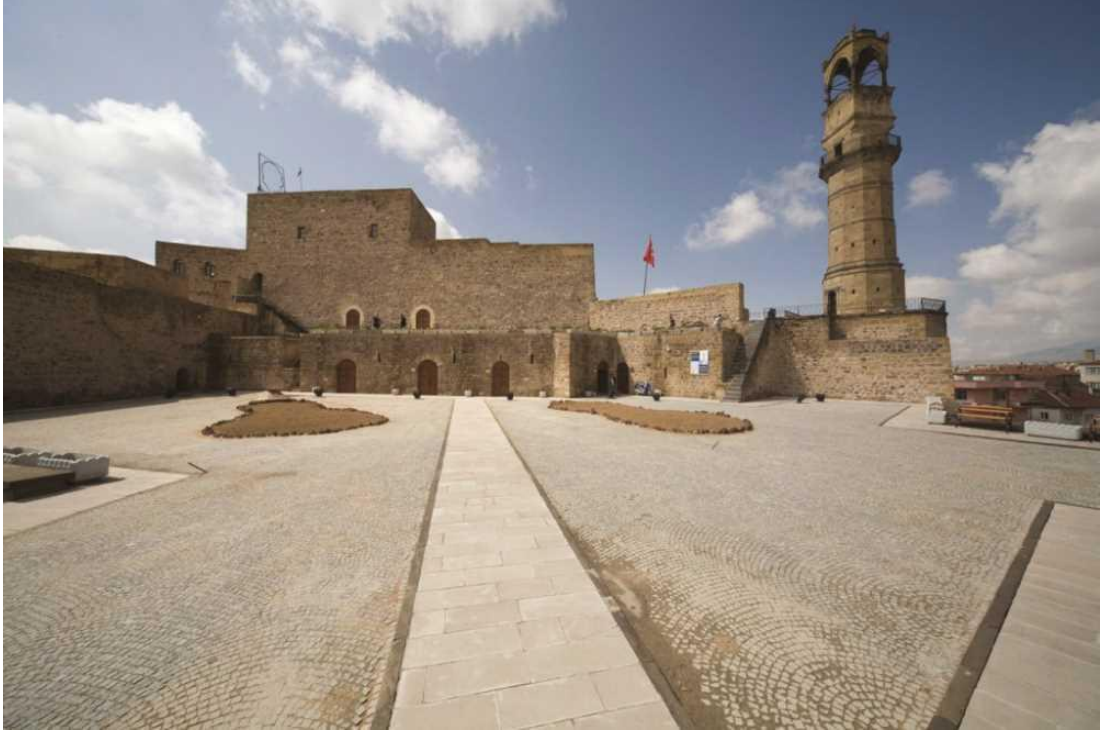
Şekil 4. Niğde Kalesi.

Medrese, Göl, Nehir, Dağ gibi pek çok alternatif içerik beklemektedir. Bunların bazılarını aşağıda yer verilmektedir.