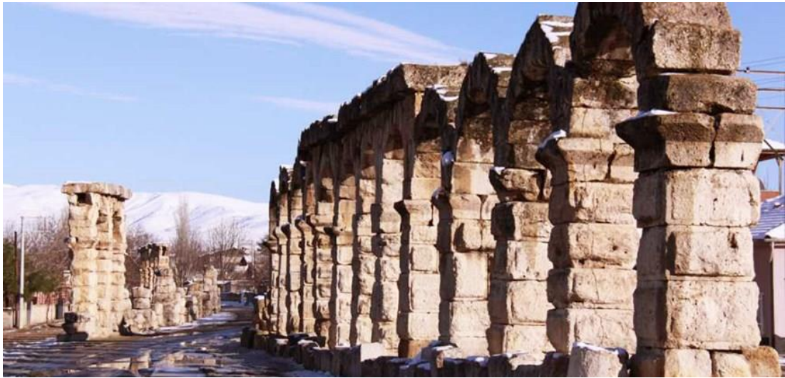
Şekil 11. Roma su kemerleri

Kapadokya'da tarihin en eski şehirlerinden biri Tyana'dır. Bir ticaret yolu üzerinde konumlandığı için Tyana, çeşitli dönemlerde yerel vatandaşlar için hayati bir buluşma yeri olarak değer kazanmıştır. Burada inşa edilen etkileyici Roma su kemeri bugün hala ayakta ve şehir, Niğde'nin Kemerhisar ilçesinde yer almaktadır.