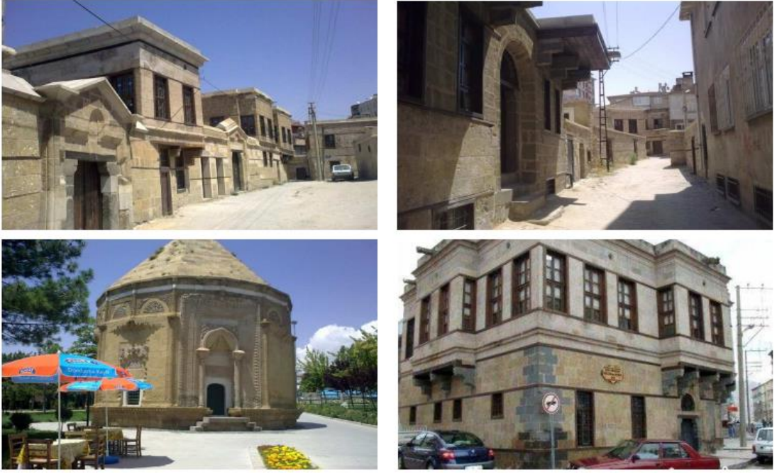
Şekil 12. Niğde'nin restore edilmiş bölgelerinin görünümü