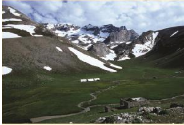
Şekil 8. Bolkar Dağı Meydan Yaylası.

Türkiye uygun iklimsel özellikleri, üst düzey peyzaj değerleri, kırsal unsurların ağırlık kazandığı geleneksel yaşam tarzı, dağcılık-tırmanış, trekking, atlı doğa gezileri, yamaç paraşütü, flora/fauna incelemesi gibi doğa sporlarına uygun alanlarla yayla turizmine oldukça elverişli bir ülke olarak karşımıza çıkmaktadır. Genel olarak 2500 m ve daha yüksek rakımlı olan Niğde yaylaları bilhassa Aladağlar ile Bolkarlar arasında yer alan yaylalar zengin bir bitki örtüsü ve dağ çiçeklerini bünyesinde barındırmaktadır. Öte yandan, bahsi geçen yaylalarda yaşayan yerli halkın folklorik unsurları, yaşam tarzları ekonomik faaliyetleri ve el sanatları, buralara gelen turistlerin dikkatlerini çekmektedir (Kemer, 2022).