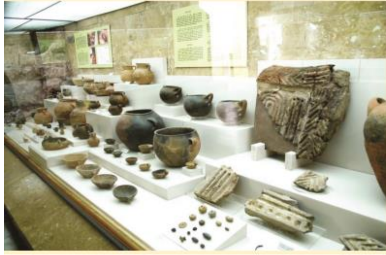
Şekil 9. Niğde Müzesi.

Niğde, zengin bir kültür varlığına sahip bir kenttir. Roma, Bizans, Selçuklu ve Osmanlı medeniyetlerinden bugüne ulaşan tarihi eserlerin önemli bir kısmı, restore edilmek suretiyle turizme sunulmuştur. Birçok kültür, medeniyet ve inanva ev sahipliği yapmış olan Niğde bu özelliği ile birlikte de önemli bir ekoturizm ivmesi kazanmaktadır.