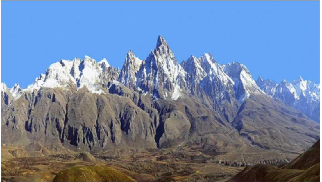
Şekil 5. Demirkazık Dağı.