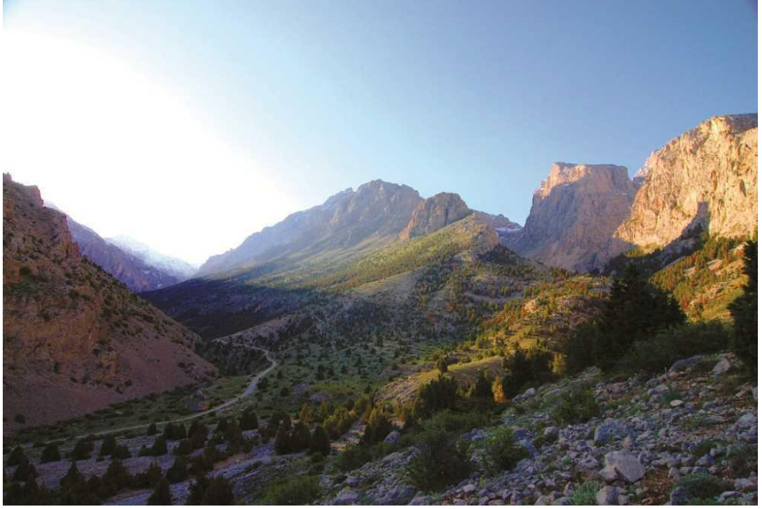
Şekil 6. Çamardı Emli Vadisi.