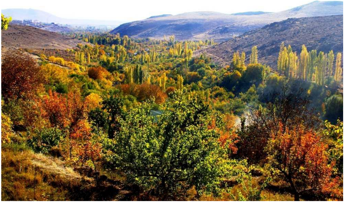
Şekil 7. Kayarardı Bağları.

Yukarıda gösterilen fotoğraflardan da anlaşılacağı üzere Niğde ili, doğa fotoğrafçılığı açısından insanları cezbedecek bir zenginliğe sahiptir. Doğa fotoğrafçılığı turistler açısından her zaman ana motivasyon kaynağı olması da her turistin en azından yan motivasyonlarından birini oluşturmaktadır. Bu noktada da